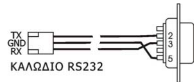
Σχήμα 2: Καλώδιο RS232

19200 baud, 8 bit, no parity. Transmit delay = 40msec/char.